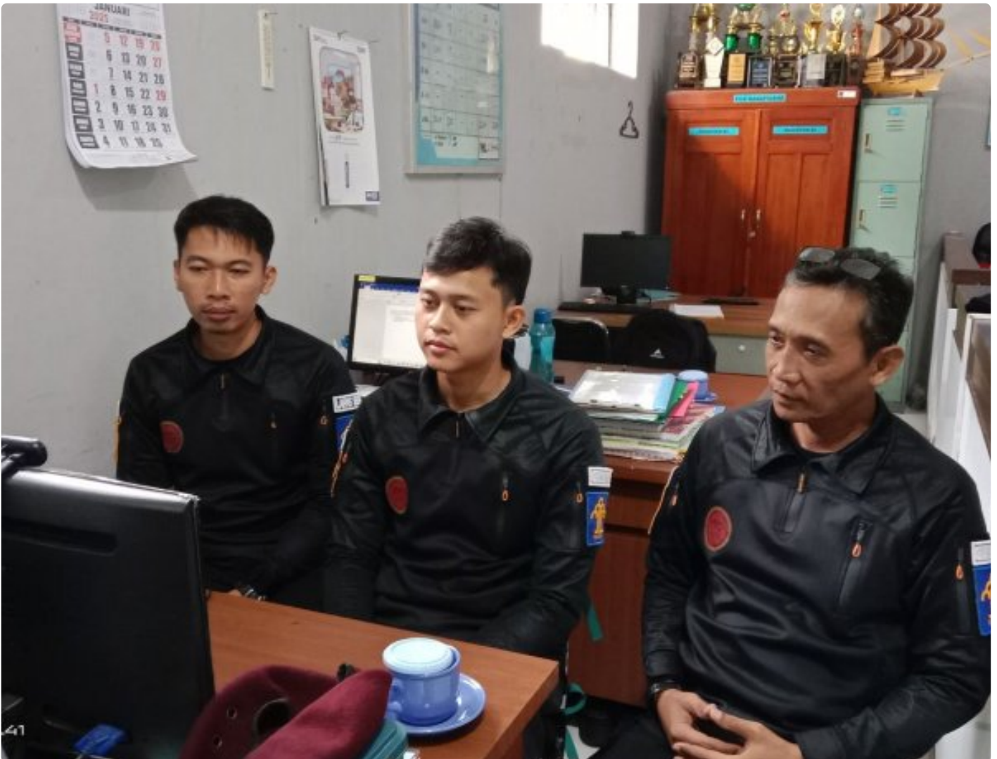
Bangun Harmoni dan Strategi, Lapas Besi Ikuti Webinar Refleksi Akhir Tahun 2024 & Resolusi 2025

CILACAP – Sebagai salah satu langkah dalam pengembangan kompetensi bagi Aparatur Sipil Negara (ASN), Petugas Lembaga Pemasyarakatan Kelas IIA Besi